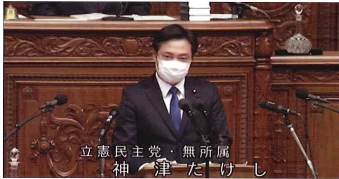
立憲民主党・無所属 神津たけし