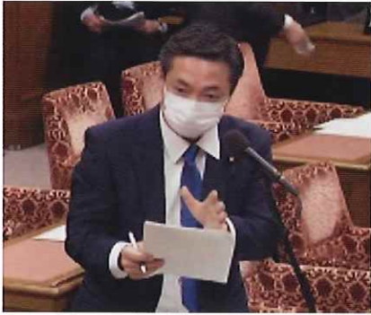
初発言の財務委員会！