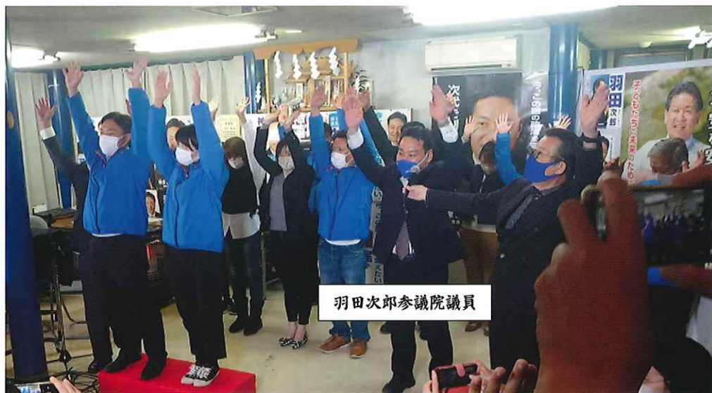
羽田次郎参議院議員