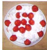
私の誕生日に息子たちが作ってくれたケーキ