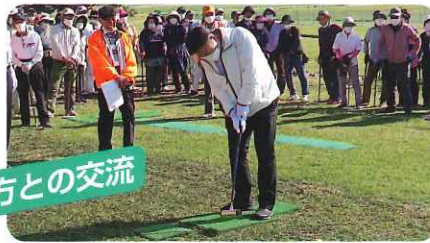
地域の方との交流