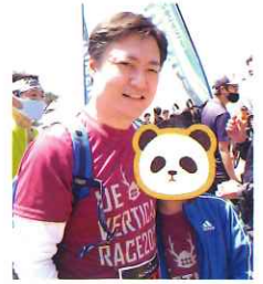
GWには、息子と太郎山パーティカルレースに参加

長野は、羽田孜、羽田雄一郎が愛した土地です。その思いを私も引き継いでまいります。