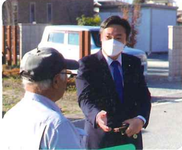
一期一会を大切に

国会がない朝は、できるだけ街頭に立って政策を訴えさせていただいています。また、1軒1軒お訪ねしてご意見をお伺いしています。地域の行事にも積極的に参加してまいります。