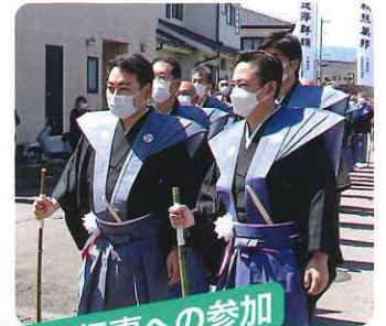
地元行事への参加